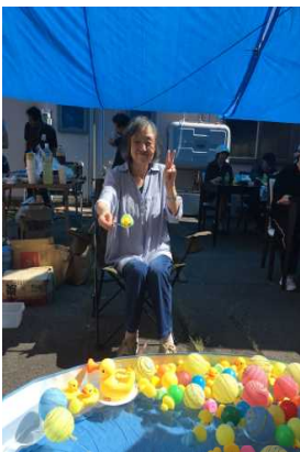
アヒルすくいです