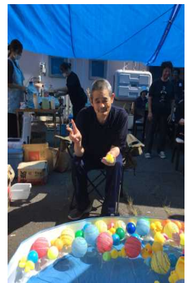
晴天でございます