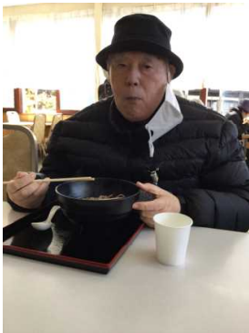
山菜そば美味しいなあ