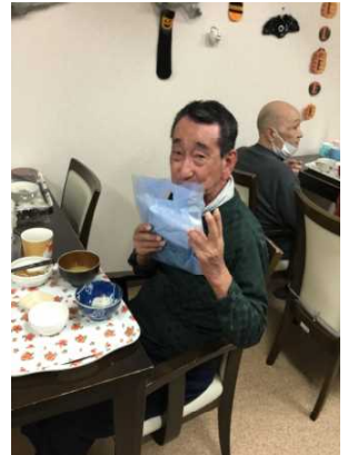
二十歳になりました