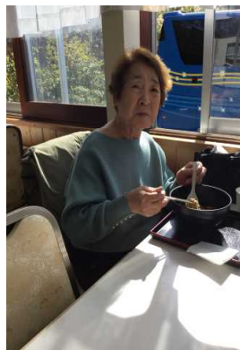
紅葉がキレイだきゃ