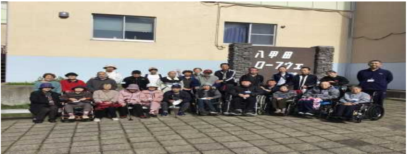
八甲田ロープウェイ