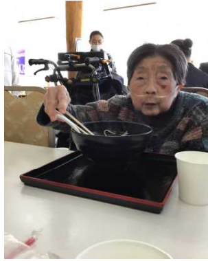
八甲田のそばだよ