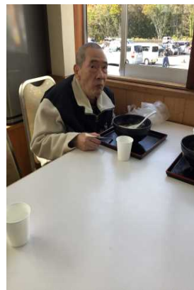
おかわりください