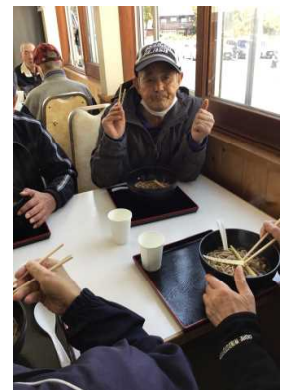
五平餅も食べるよ