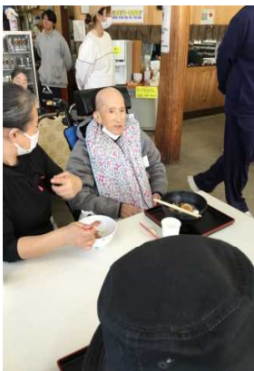
先に一曲歌いたい