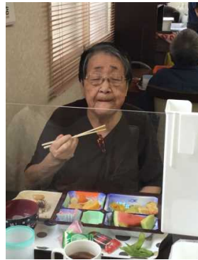
今年の初スイカです