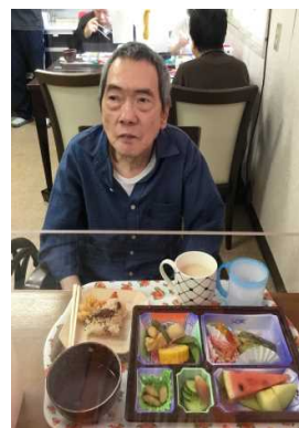
スタミナつけないとね