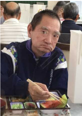
メロンから食べる