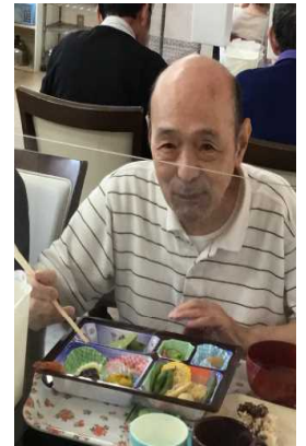
残暑を乗り越えよう