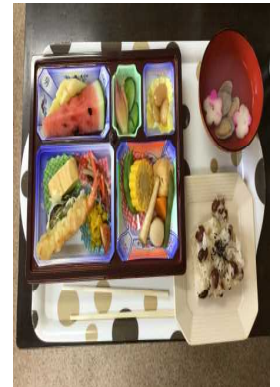
ささやかですがどうぞ