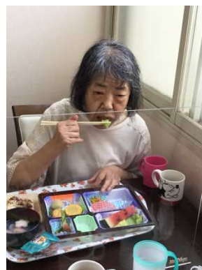
毎週土曜これ食べたい