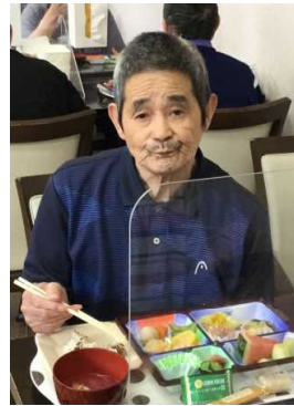
ホタテ食べたいじゃ