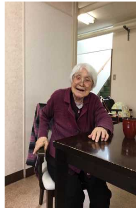
ごちそうさまでした