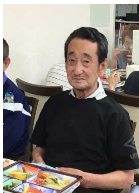
昼からごちそうですか