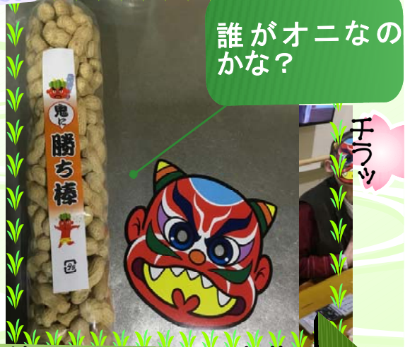
節分イベント写真集