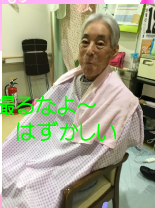
撮るなよ～ はずかしい

系列の「あさひちょう」スタッフのご主人にベッド上でカットしてもらいました！ 久しぶりのヘアカットです！