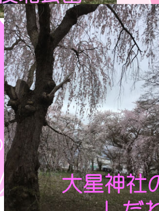
大星神社の しだれ桜