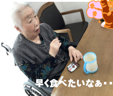
早く食べたいなあ・・・