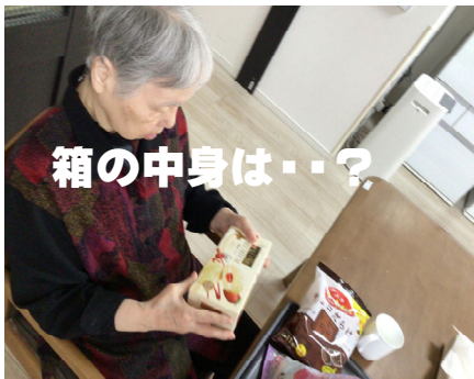
箱の中身は・・・?